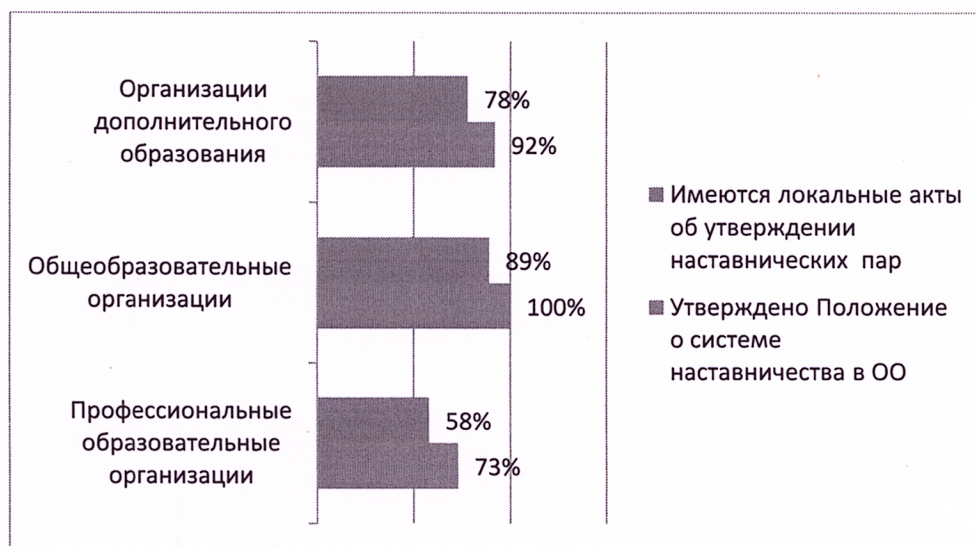
Рис. 2. Наличие локальных актов, регламентирующих ЦМН в ОО

Согласно рекомендациям Министерства просвещения о внедрении целевой модели наставничества педагогических работников в образовательных учреждениях должны быть приняты локальные акты, регламентирующие деятельность в рамках ЦМН, в частности, положение о системе Наставничества, приказы об утверждении наставнических пар. Результаты представлены на рисунке 2.